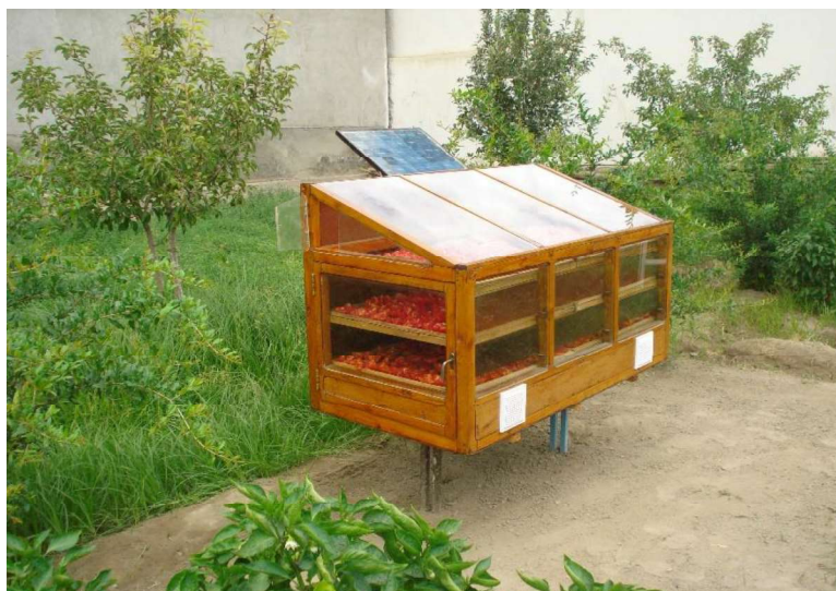
Рис 2. Общий вид мини гелиосушилки – теплицы в рабочем режиме